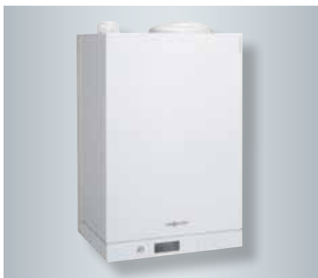
Vitodens 111-W, beépített 46 literes nemesacél tárolóval