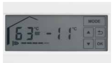
Háttérvilágítással rendelkező, érintőképernyős LCD képernyő.

Az új Vitodens 100-W és Vitodens 111-W kezelését már háttérvilágítással rendelkező LCD-érintőképernyőn végezheti. A kijelző sötét környezetben is könnyen leolvasható és komfortosan kezelhető.