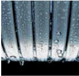
A kazántest központi eleme: saválló nemesacélból készített Inox-Radial hőcserélő.